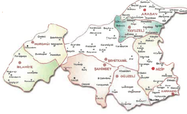
Gaziantep İlinin İlçeleri