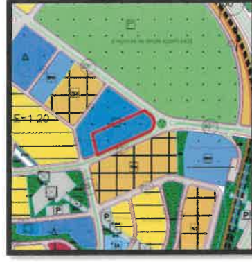
1/5.000 Ölçekli Mevcut Nazım İmar Planı