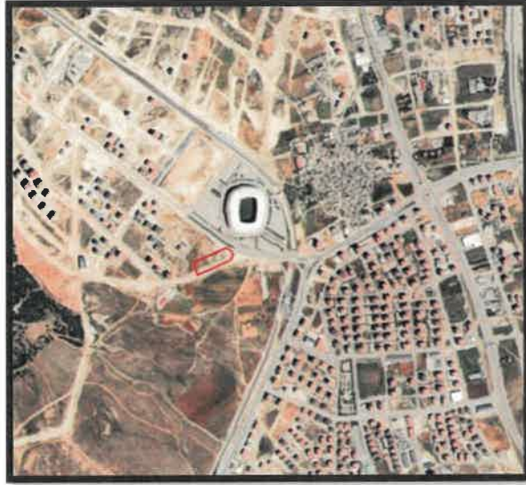
Planlama Alanının Konumu

Plan değişikliğine konu olan, Göktürk Mahallesi N38-C3 ve N38C-13C paftalarında bulunan alan Kalyon Stadyumu güneyinde bulunmaktadır.