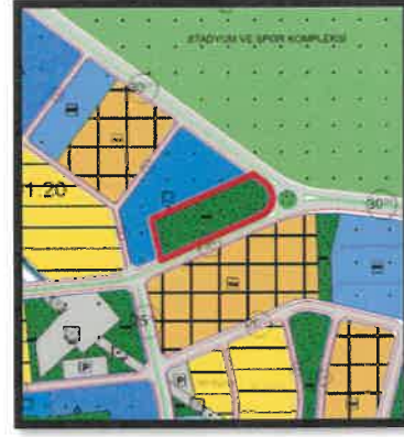
1/5.000 Ölçekli Öneri Nazım İmar Planı