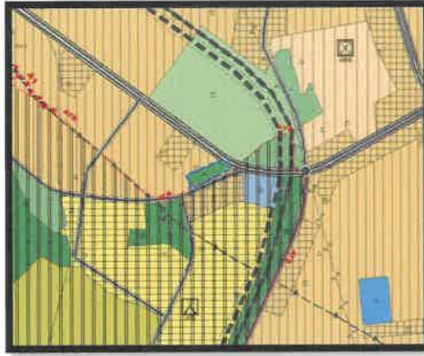
1/25.000 Ölçekli Öneri Nazım İmar Planı

Plan değişikliğine konu olan alanda yeşil alan ihtiyacının karşılanabilmesi amacıyla park alanı planlanması suretiyle 1/25.000 ve 1/5.000 ölçekli nazım imar planı değişikliği hazırlanmıştır.