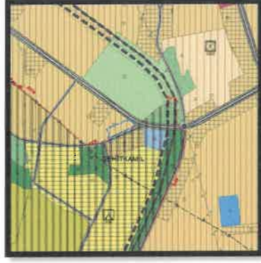
1/25.000 Ölçekli Mevcut Nazım İmar Planı