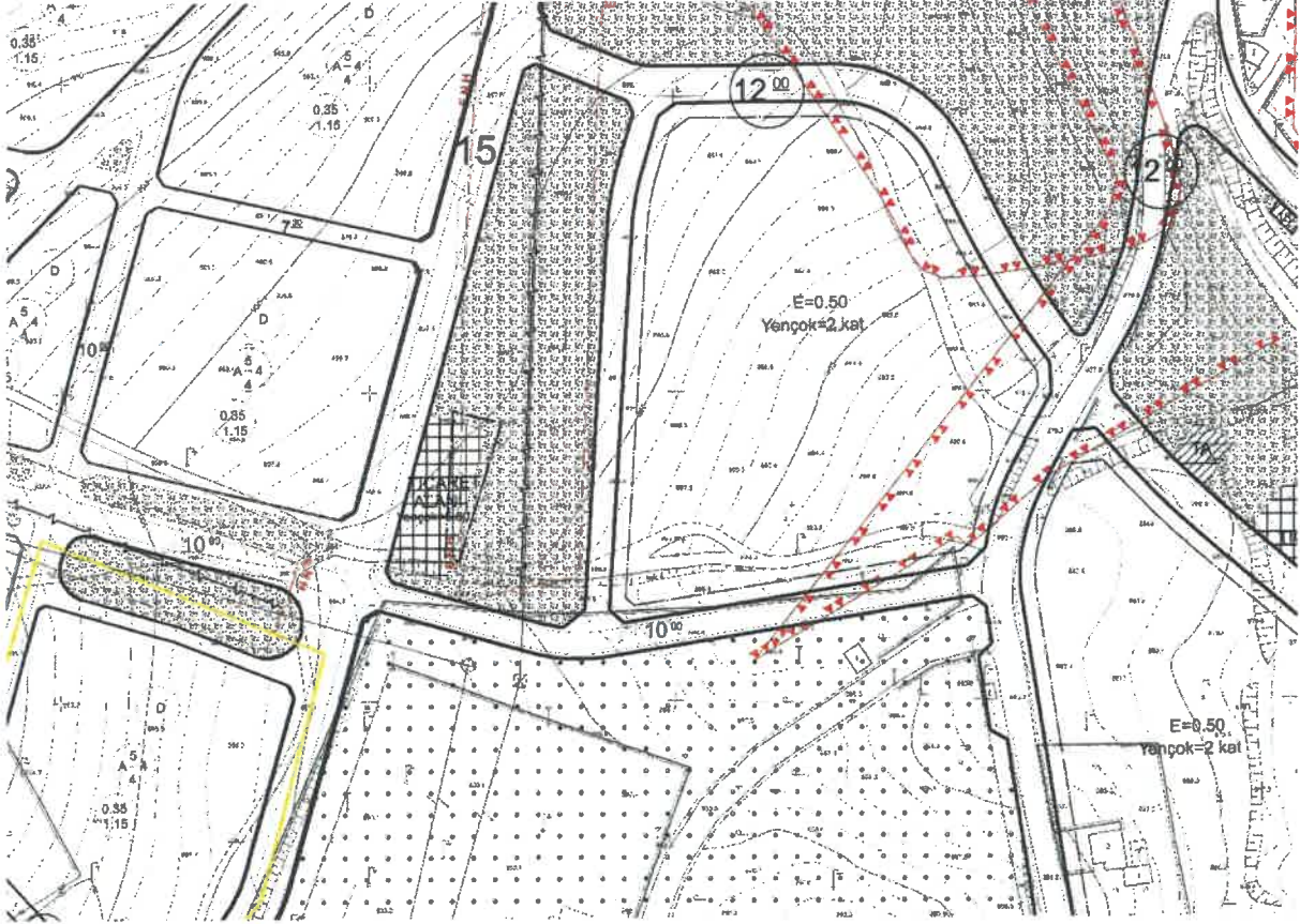
Şekil 2: Mevcut 1/1000 Ölçekli uygulama İmar Planı

Planlama alanı mevcut 1/1000 ölçekli uygulama imar planında ticaret alanı ve enerji nakil hattı koruma bandı olarak görülmektedir.