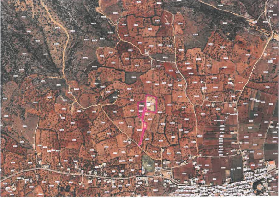
Şekil 1: Planlama Alanının Konumu

Planlama bölgesi, Şehitkamil İlçesi Karacaburç Mahallesi sınırları içerisinde yer almaktadır.