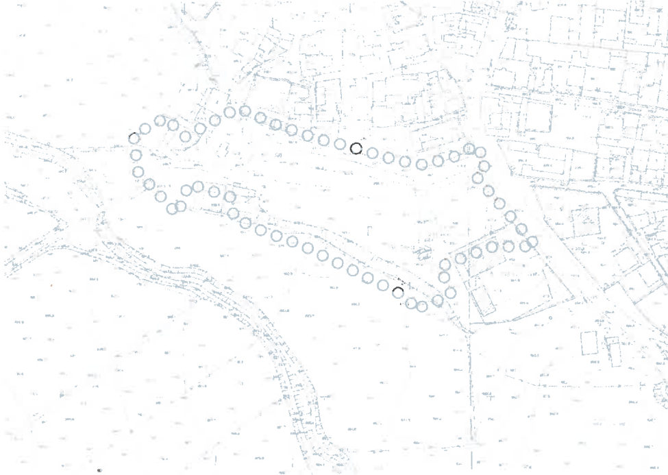
Şekil 2: Planlama Alanı Mevcut 1/1000 Ölçekli Uygulama İmar Planı

Plan değişikliğine konu alan mevcut 1/1000 ölçekli uygulama imar planında Plansız Alan olarak görülmektedir.