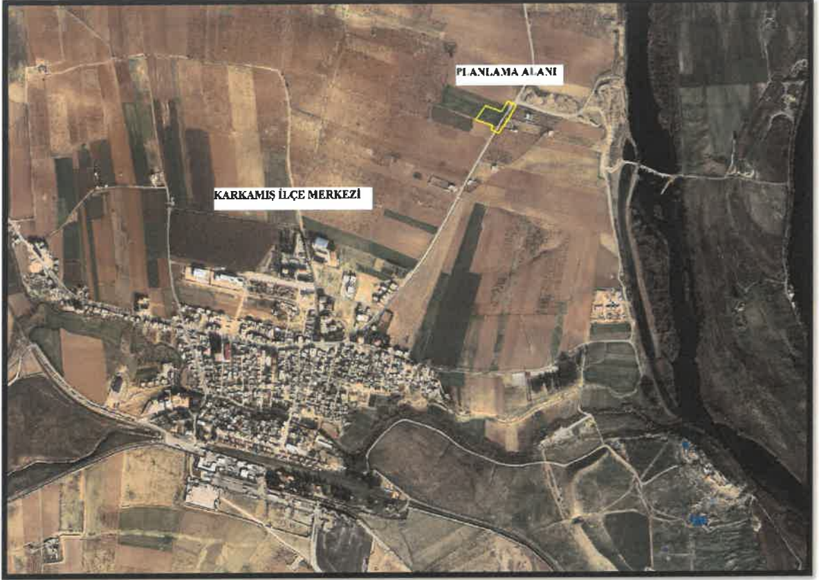
Şekil 1: Planlama Alanı Konumu

Söz konusu planlama alanı Gaziantep ili, Karkamış İlçesi, Karşıyaka Mahallesi içerisinde İlçe Merkezinin Kuzeydoğusunda yer almaktadır.