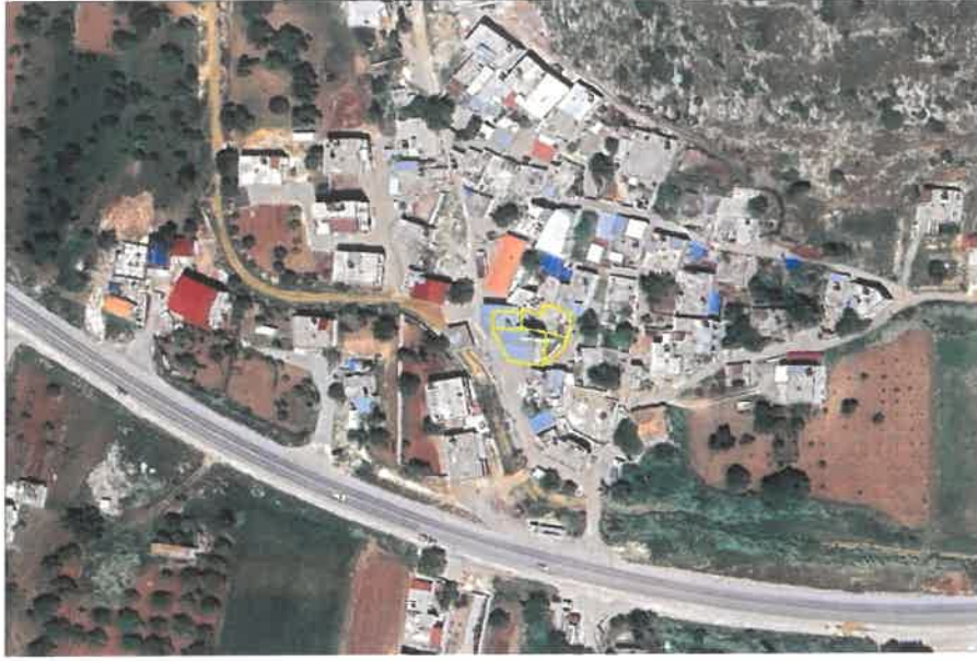
Şekil 1: Planlama Alanının Konumu

Planlama alanı Şehitkamil İlçesi, Yeşilce Mahallesi sınırları içerisinde yer almaktadır.