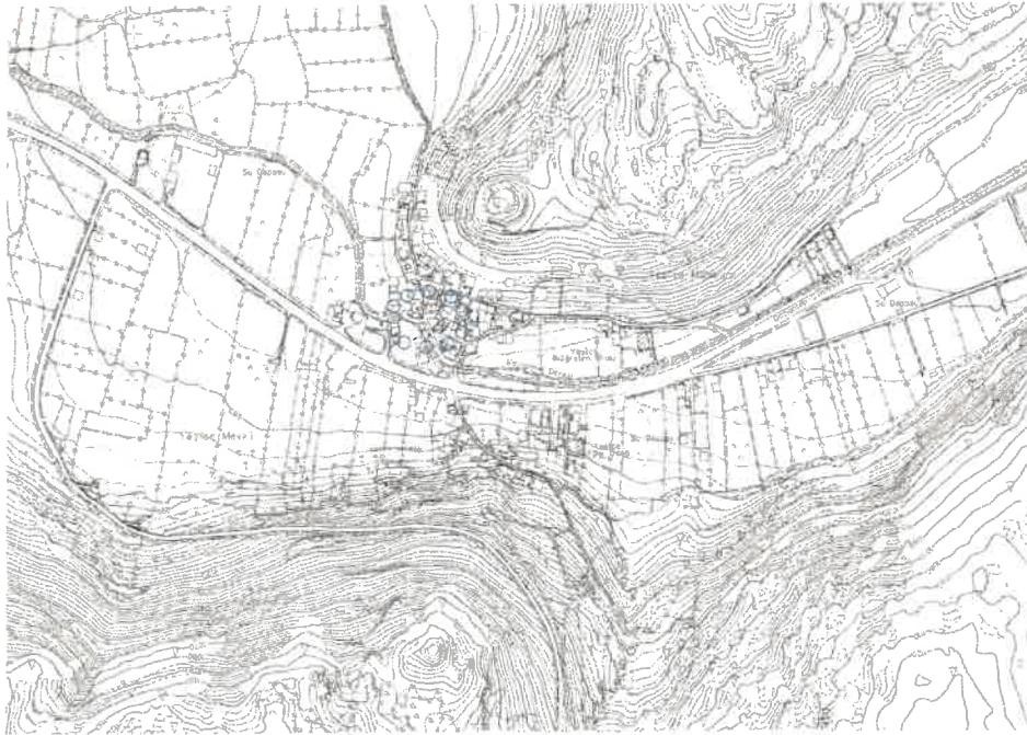
Şekil 2: Mevcut 1/5000 Ölçekli Nazım İmar Planı

Planlama alanı mevcut 1/5.000 ölçekli nazım imar planında plansız alan olarak görülmektedir.